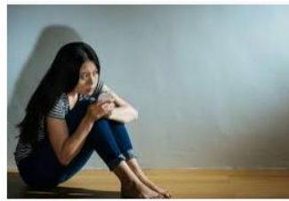
Migrant women are particularly ... phys.org