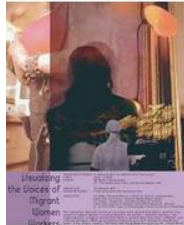
Visualizing the Voices ... voicesofwomenmedia.org