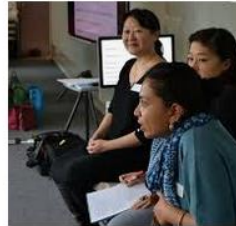
Visualizing the Voices of Migma...