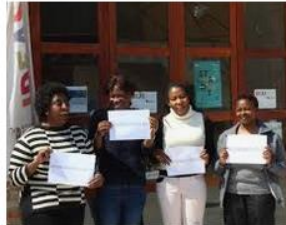
Migrant women, asylum seekers and ... cesie.org