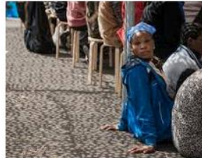
Who's responsible for violence against... opendemocracy.net