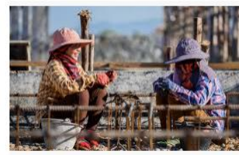
Putting the Spotlight on Women Migrant ... ourworld.unu.edu