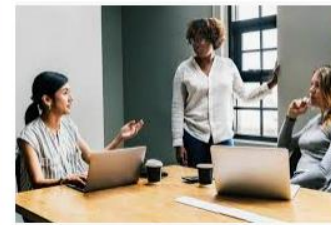
MedLIT: A new course for migrant women ... cesie.org